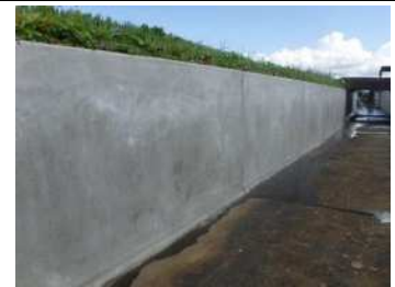
壁面施工完了写真

MY-300S システムは、特殊粉末樹脂と特殊短繊維を既調合した材形のホリマセメントモルタルである「Zモルタル MY-300S」を用いた用水路補修用モルタルライニング工法で、農業利水施設の補修・補強工事に関するマニュアル【開水路補修編】(案)に適合した材料です。