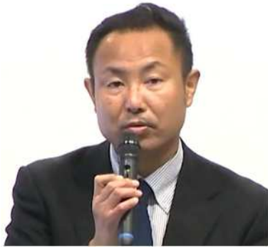
国土交通省 隅藏企画調整官

i)建設リサイクルの現状では、2018年度の建設副産物のリサイクル率については、建設混合廃棄物が唯一90%を下回っているが、他の品目は90%以上となっているなどの建設リサイクルの現状が紹介されました。