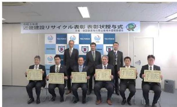
近畿建設リサイクル表彰（R3年度）